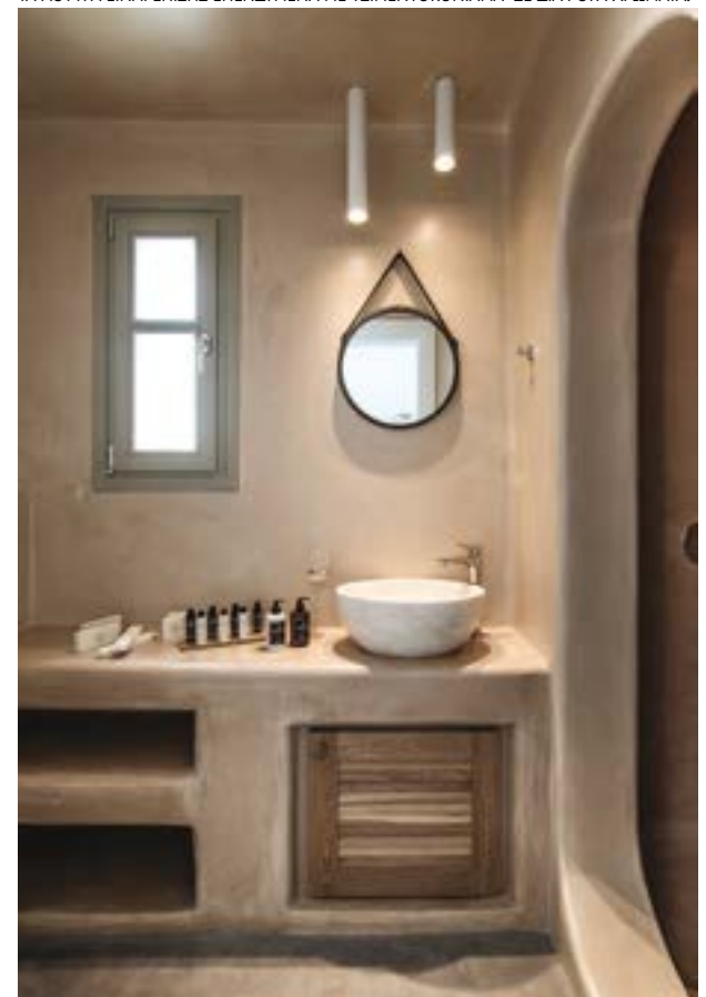
ΤΑ ΛΟΥΤΡΑ ΕΙΝΑΙ ΕΠΙΣΗΣ ΕΠΕΝΔΥΜΕΝΑ ΜΕ ΤΣΙΜΕΝΤΟΚΟΝΙΑΜΑ ΣΕ ΔΙΑΦΟΡΑ ΧΡΩΜΑΤΑ.