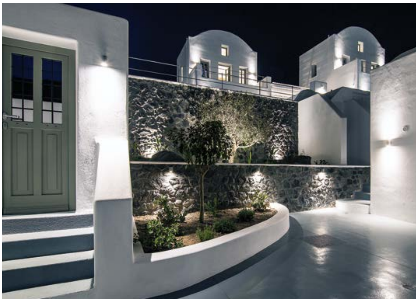
Η ΠΕΤΡΑ, ΤΟ ΓΚΡΙΖΟ ΤΣΙΜΕΝΤΟΚΟΝΙΑΜΑ ΚΑΙ ΟΙ ΛΕΥΚΟΙ ΕΠΙΧΡΙΣΜΕΝΟΙ ΤΟΙΧΟΙ ΠΑΡΑΠΕΜΠΟΥΝ ΣΤΗΝ ΤΟΠΙΚΗ ΑΡΧΙΤΕΚΤΟΝΙΚΗ ΚΑΙ ΦΥΣΗ.

Οι βίλες αναπτύσσονται σε τρία επίπεδα και διαθέτουν ένα άνετο καθιστικό, τραπεζαρία, και χώρο κουζίνας, δύο μπάνια και δύο υπνοδωμάτια –ένα υπόσκαφο και ένα στον πρώτο όροφο, που διαθέτει en-suite μπάνιο και ιδιωτική βεράντα. Κάθε βίλα και σουίτα διαθέτει ιδιωτική υπαίθρια εκτόνωση σε αυλή με καθιστικό και θερμαινόμενη πισίνα. Η κατασκευή του συγκροτήματος έχει γίνει