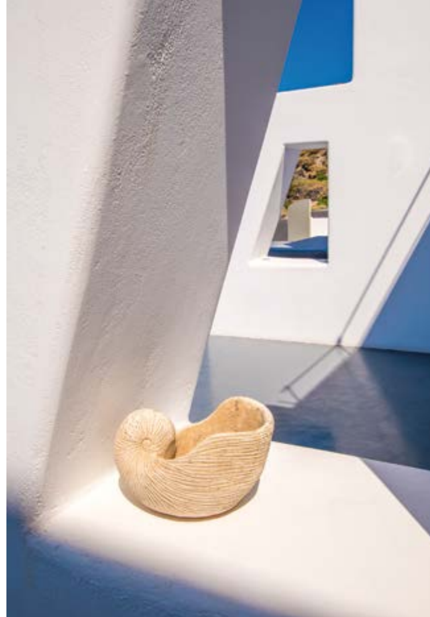
ΟΙ ΤΟΙΧΟΙ ΕΠΙΚΑΛΥΠΤΟΝΤΑΙ ΜΕ ΕΠΙΧΡΙΣΜΑ ΛΕΥΚΟΥ ΧΡΩΜΑΤΟΣ ΣΥΜΦΩΝΑ ΜΕ ΤΟ ΠΑΡΑΔΟΣΙΑΚΟ ΠΡΟΤΥΠΟ.