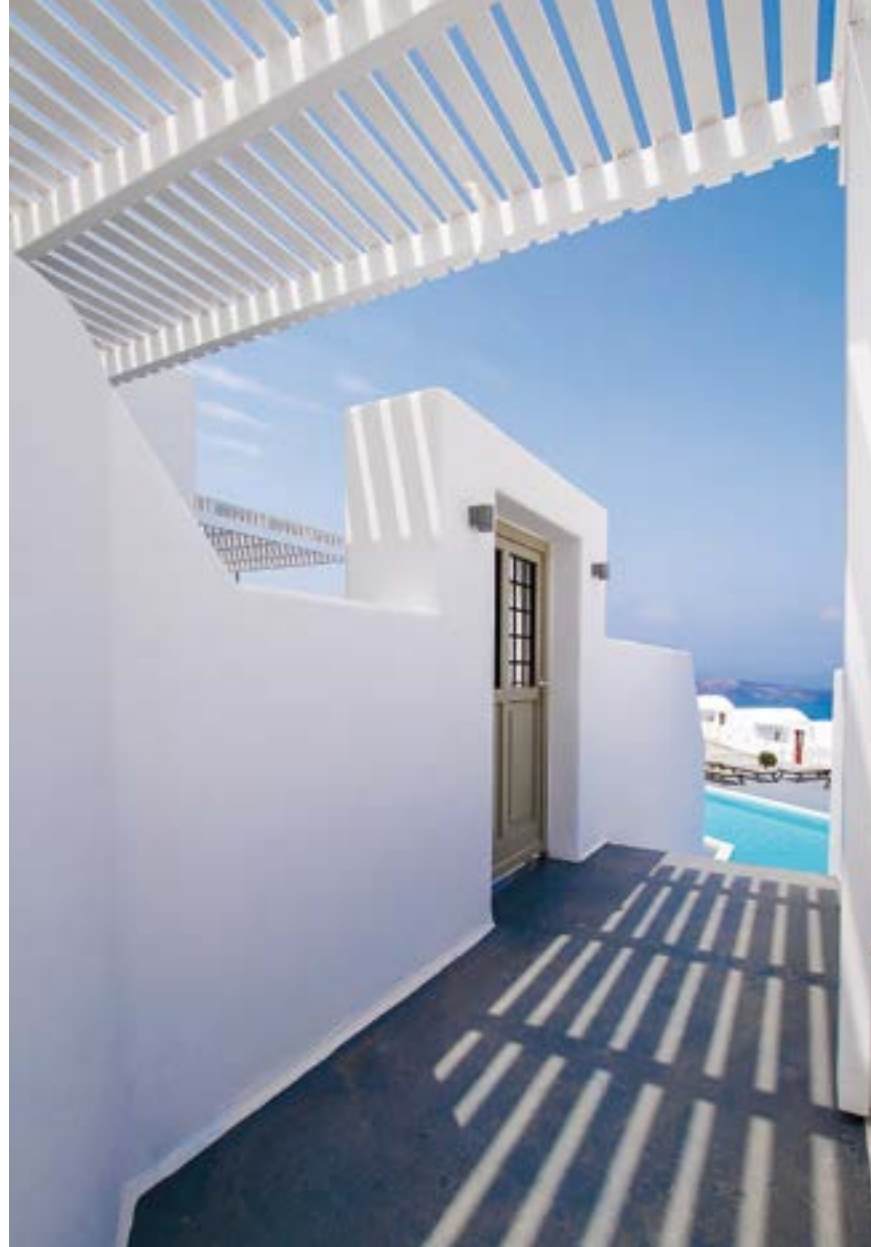
ΛΕΠΤΟΜΕΡΕΙΑ ΤΗΣ ΕΙΣΟΔΟΥ ΒΙΛΑΣ ΣΤΗ ΔΙΑΔΡΟΜΗ ΠΡΟΣ ΤΗΝ ΚΟΙΝΟΧΡΗΣΤΗ ΠΙΣΙΝΑ.

Το Cape 9 Luxury Villas & Suites σχεδιάστηκε έχοντας βασικούς γνώμονες το διαχρονικό σχεδιασμό και τη λιτή οικειότητα της νησιώτικης αισθητικής, ώστε να "παντρεύεται" ο ιδιαίτερος χαρακτήρας της Σαντορίνης με τις μοντέρνες ανέσεις και το σύγχρονο εξοπλισμό. Η μορφολογία των παραδοσιακών λευκών υπόσκαφων και θολωτών κτιρίων πρωταγωνιστεί στην αρχιτεκτονική σύνθεση, η οποία, σεβόμενη τη γεωφυσική φυσιογνωμία και τον ηφαιστειακό χαρακτήρα του νησιού, εναρμονίζει το συγκρότημα στο περιβάλλον