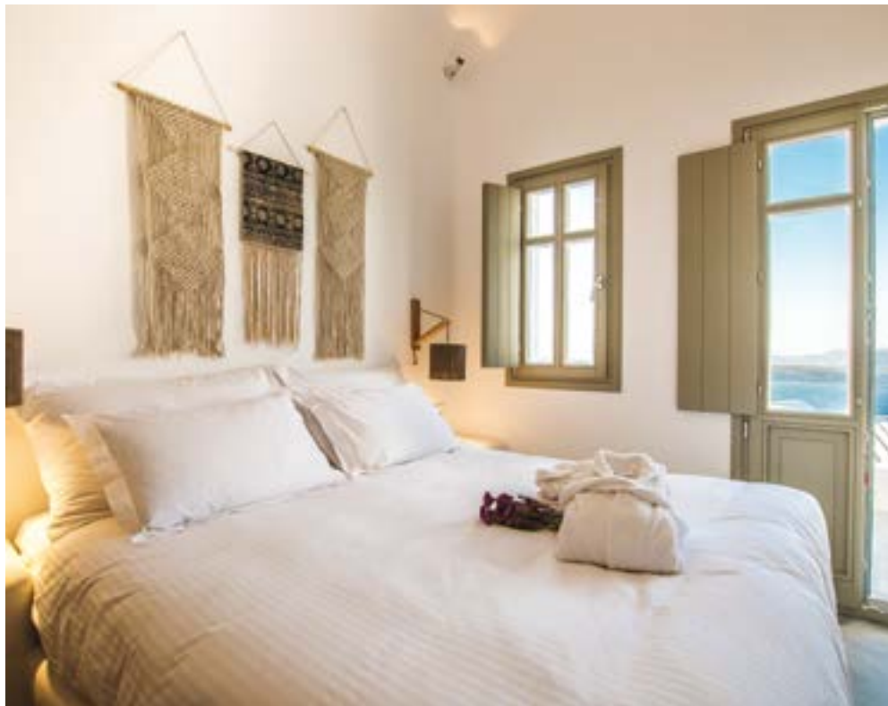
ΟΙ ΑΠΟΧΡΩΣΕΙΣ ΤΩΝ ΞΥΛΙΝΩΝ ΕΠΙΠΛΩΝ ΚΑΙ ΤΩΝ ΕΠΙ ΜΕΡΟΥΣ ΔΙΑΚΟΣΜΗΤΙΚΩΝ ΣΤΟΙΧΕΙΩΝ ΔΗΜΙΟΥΡΓΟΥΝ ΜΙΑ ΓΑΛΗΝΙΑ ΚΑΙ ΕΥΧΑΡΙΣΤΗ ΑΤΜΟΣΦΑΙΡΑ.

με τη χρήση σύγχρονων κατασκευαστικών μεθόδων, διατηρώντας όμως τον παραδοσιακό χαρακτήρα του νησιού. Ως εκ τούτου, οι τοίχοι επικαλύπτονται από επίχρισμα λευκού χρώματος, ώστε να μην υπάρχει μορφολογική απόκλιση από το παραδοσιακό πρότυπο. Παράλληλα, το γκρι χρώμα των δαπέδων από πατητό τσιμεντοκονίαμα αναδεικνύει και ξεχωρίζει τις λευκές δομές, ενώ η συνέχεια του δαπέδου και της χρήσης του λευκού χρώματος στο εσωτερικό των κτιρίων δρα ως ενοποιητικό στοιχείο μεταξύ των κλειστών και των υπαίθριων χώρων. Ωστόσο, οι χώροι των λουτρών έχουν τη δική τους ιδιαίτερη "πινελιά", καθώς είναι βαμμένοι με ειδική τεχνοτροπία σε χρώματα μπλε, κόκκινο ή ώχρα. Αυτή η κατασκευή σε συνδυασμό με τη διακόσμηση αποδίδει μία μοντέρνα και "γήινη" αισθητική στους χώρους. Οι ανοιχτές αποχρώσεις του καφέ των ξύλινων κουφωμάτων, των ξύλινων επίπλων, αλλά και των επί μέρους ψάθινων και πλεκτών διακοσμητικών στοιχείων συνδυάζονται ισορροπημένα και δημιουργούν μία γαλήνια και ευχάριστη ατμόσφαιρα, που ξεκουράζει και αναζωογονεί τον επισκέπτη.