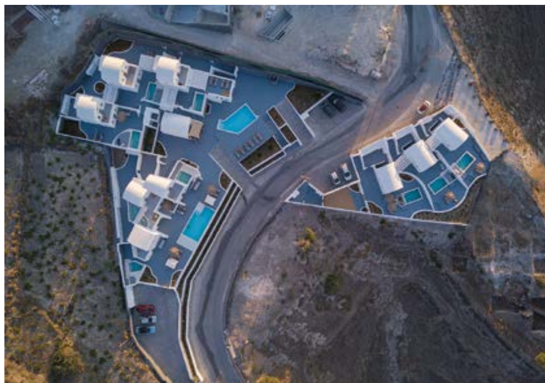
ΠΑΝΟΡΑΜΙΚΗ ΑΠΟΨΗ ΤΟΥ ΣΥΓΚΡΟΤΗΜΑΤΟΣ.