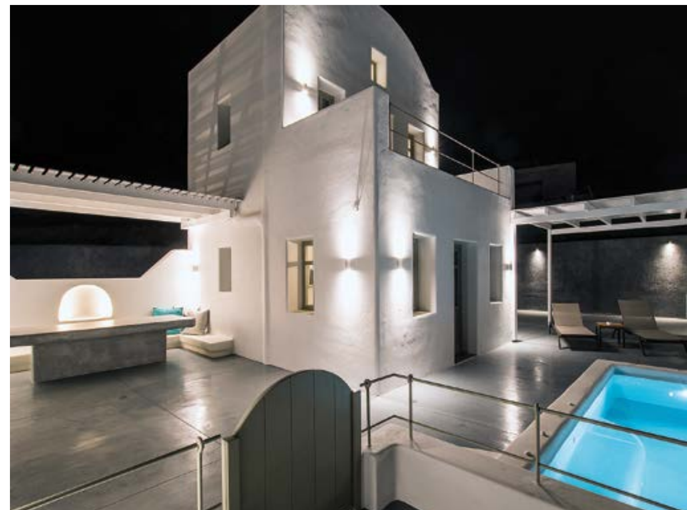
ΑΠΩΝΗ ΒΙΛΑΣ ΜΕ ΙΔΙΩΤΙΚΗ ΑΥΛΗ ΜΕ ΚΑΘΙΣΤΙΚΟ ΚΑΙ ΘΕΡΜΑΙΝΟΜΕΝΗ ΠΙΣΙΝΑ.