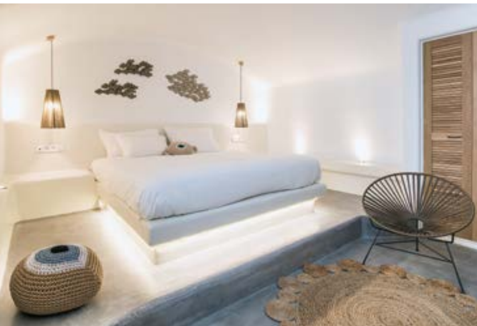
ΤΟ ΓΚΡΙΖΟ ΤΣΙΜΕΝΤΟΚΟΝΙΑΜΑ ΣΤΑ ΔΑΠΕΔΑ ΚΑΙ ΟΙ ΛΕΥΚΟΙ ΤΟΙΧΟΙ ΕΝΟΠΙΟΥΝ ΤΟΥΣ ΕΣΩΤΕΡΙΚΟΥΣ ΜΕ ΤΟΥΣ ΕΞΩΤΕΡΙΚΟΥΣ ΧΩΡΟΥΣ.

με τη χρήση σύγχρονων κατασκευαστικών μεθόδων, διατηρώντας όμως τον παραδοσιακό χαρακτήρα του νησιού. Ως εκ τούτου, οι τοίχοι επικαλύπτονται από επίχρισμα λευκού χρώματος, ώστε να μην υπάρχει μορφολογική απόκλιση από το παραδοσιακό πρότυπο. Παράλληλα, το γκρι χρώμα των δαπέδων από πατητό τσιμεντοκονίαμα αναδεικνύει και ξεχωρίζει τις λευκές δομές, ενώ η συνέχεια του δαπέδου και της χρήσης του λευκού χρώματος στο εσωτερικό των κτιρίων δρα ως ενοποιητικό στοιχείο μεταξύ των κλειστών και των υπαίθριων χώρων. Ωστόσο, οι χώροι των λουτρών έχουν τη δική τους ιδιαίτερη "πινελιά", καθώς είναι βαμμένοι με ειδική τεχνοτροπία σε χρώματα μπλε, κόκκινο ή ώχρα. Αυτή η κατασκευή σε συνδυασμό με τη διακόσμηση αποδίδει μία μοντέρνα και "γήινη" αισθητική στους χώρους. Οι ανοιχτές αποχρώσεις του καφέ των ξύλινων κουφωμάτων, των ξύλινων επίπλων, αλλά και των επί μέρους ψάθινων και πλεκτών διακοσμητικών στοιχείων συνδυάζονται ισορροπημένα και δημιουργούν μία γαλήνια και ευχάριστη ατμόσφαιρα, που ξεκουράζει και αναζωογονεί τον επισκέπτη.