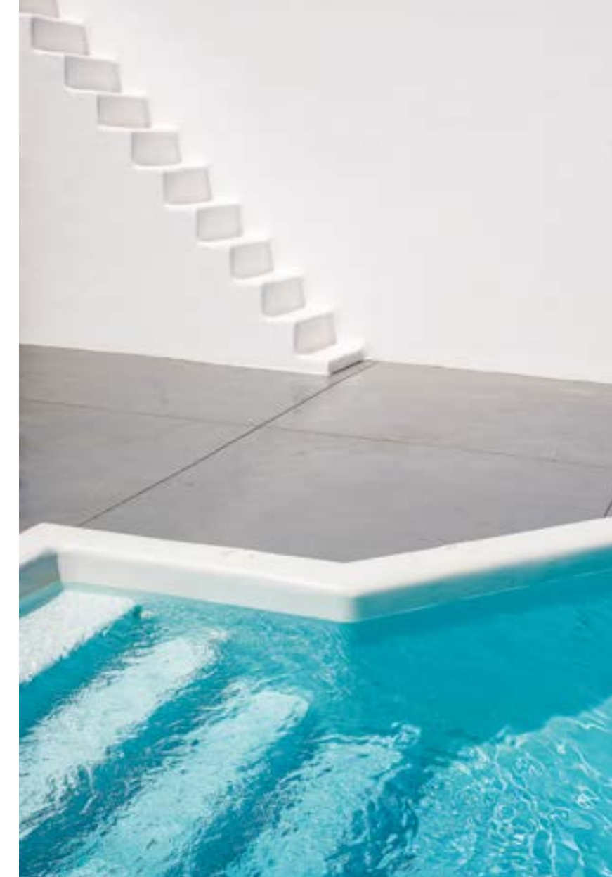
ΣΤΗ ΜΕΓΑΛΗ ΕΝΟΤΗΤΑ ΤΟΥ ΣΥΓΚΡΟΤΗΜΑΤΟΣ ΒΡΙΣΚΟΝΤΑΙ ΔΥΟ ΚΟΙΝΟΧΡΗΣΤΕΣ ΠΙΣΙΝΕΣ.